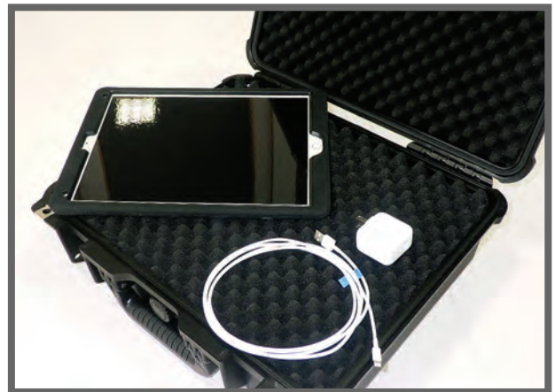
輸送用ケースでタブレットを発送