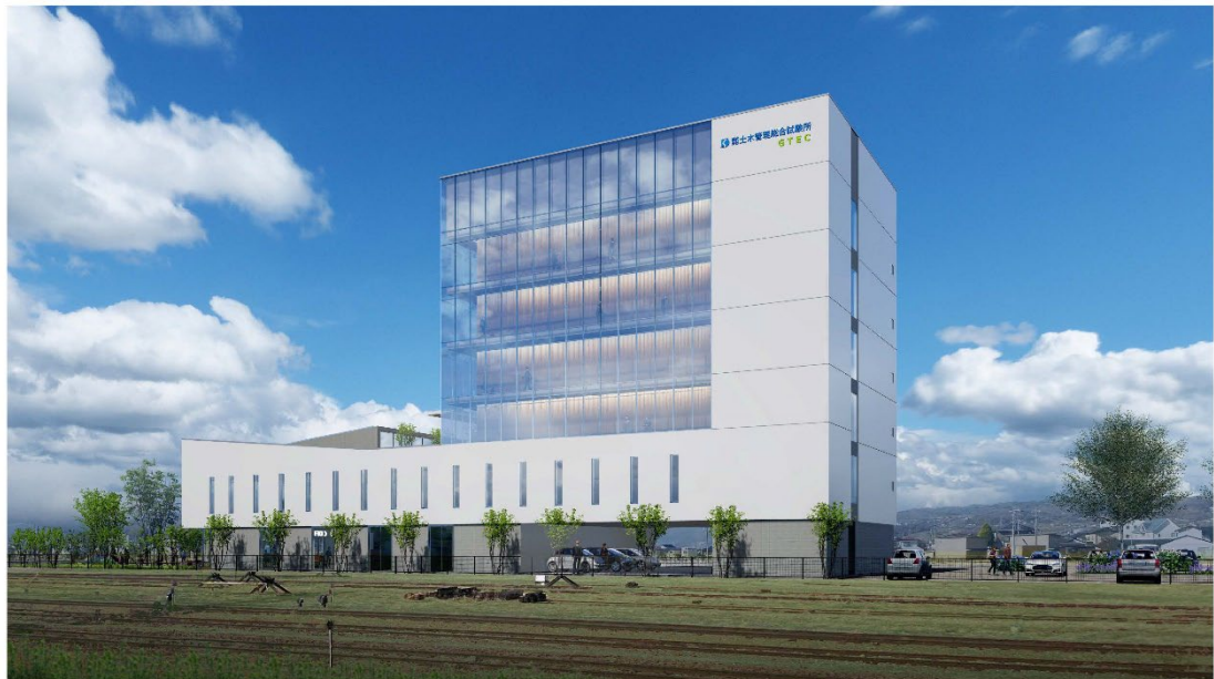
▲緑島良から見たイメージ