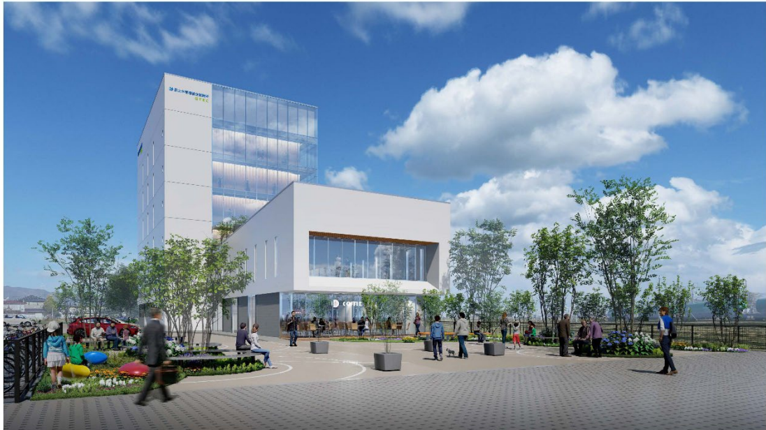
▲ロータリー側から見たイメージ