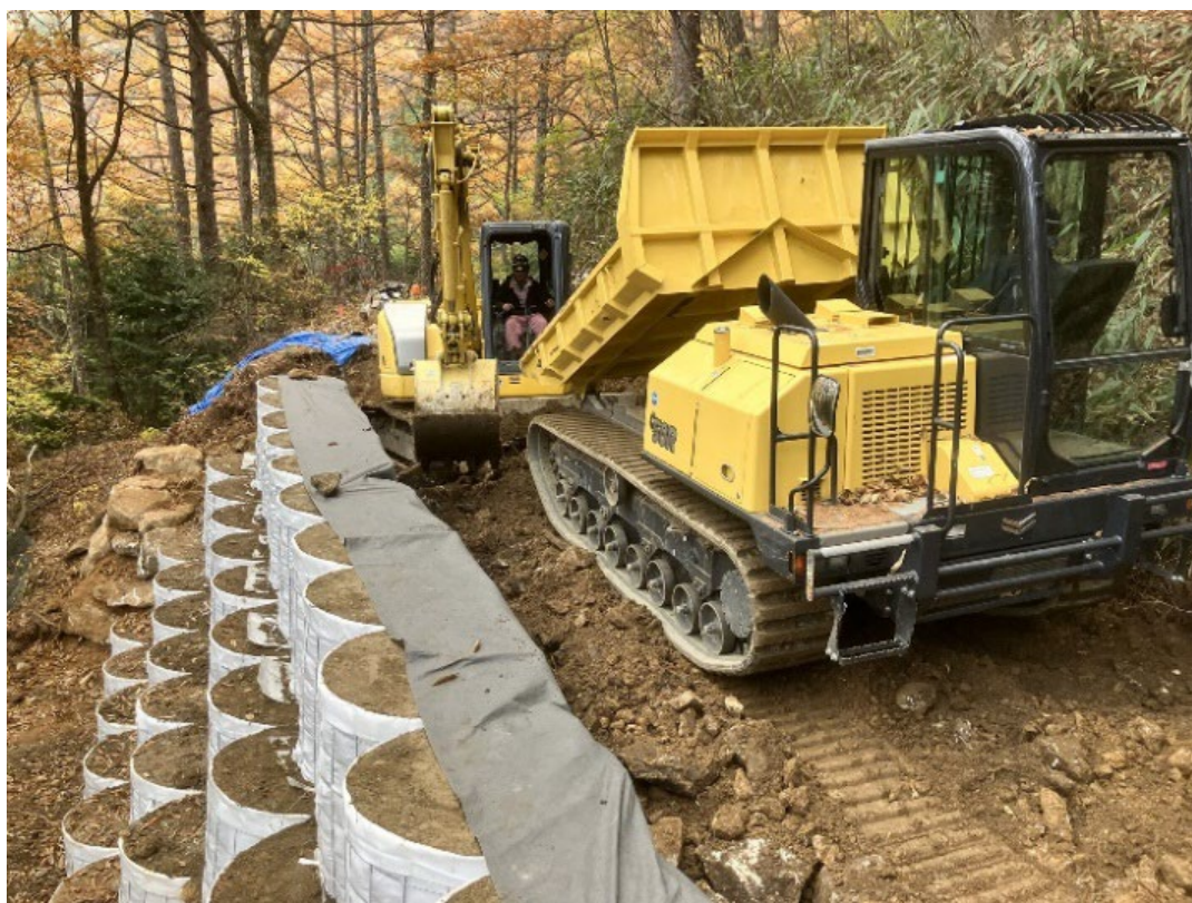
山間部における「ソイルセメントを利用した円形コンバック」の施工事例

ソイルセメント材を円形コンバック®の内部に充填することで、コスト削減・環境保護・作業効率の向上を同時に叶える、持続可能な建設資材としての価値が高まります。