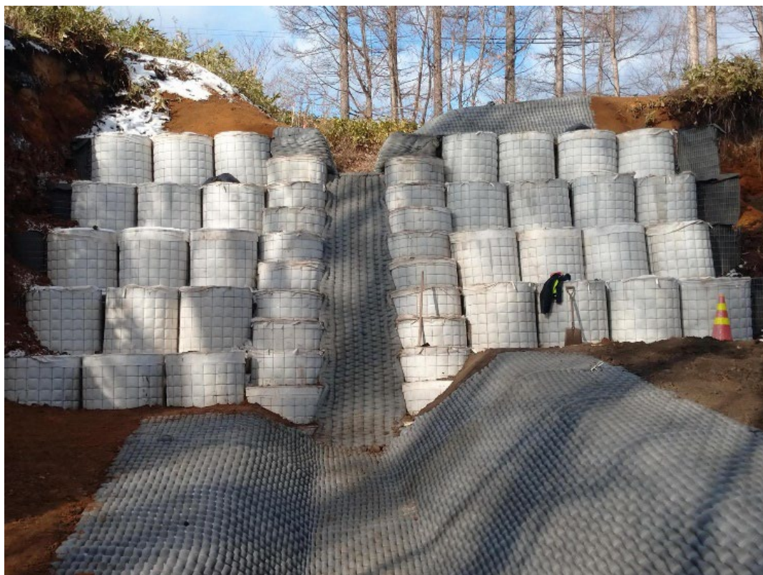
「円形コンバック®」施工事例

（特許出願中：粘性土ソイルセメントの製造方法、粘性土ソイルセメント成形体の製造方法）